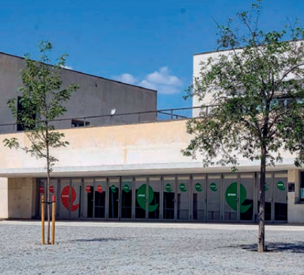
CENTRE CÍVIC PARC ESPORTIU LLOBREGAT (PELL)