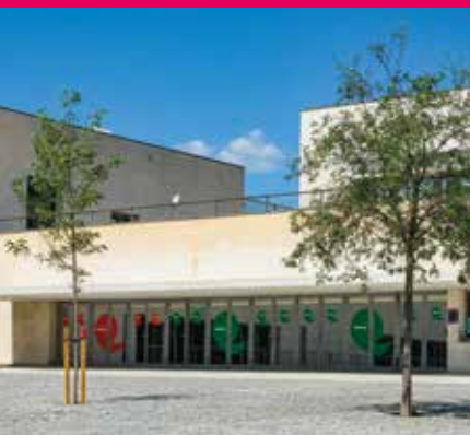
CENTRE CÍVIC PARC ESPORTIU LLOBREGAT (PELL)