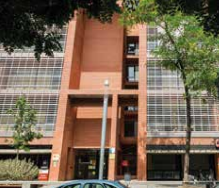
CENTRE CÍVIC LA GAVARRA